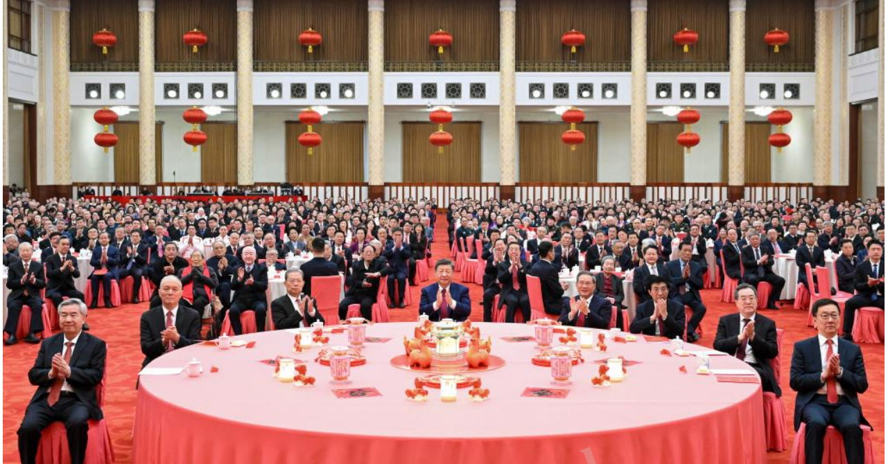
Los líderes del Partido y del Estado, Xi Jinping, Li Qiang, Zhao Leji, Wang Huning, Cai Qi, Ding Xuexiang, Li Xi y Han Zheng asisten a una recepción para dar la bienvenida al Año Nuevo chino en el Gran Palacio del Pueblo, en Beijing, capital de China, el 14 de febrero de 2026. El Comité Central del Partido Comunista de China y el Consejo de Estado celebraron la recepción aquí el sábado.