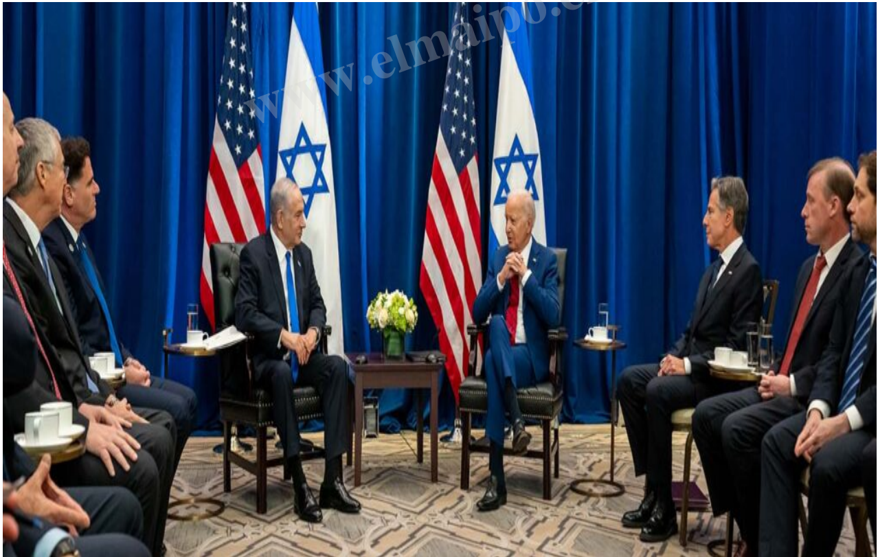
Netanyahu y Biden, Foto_dominio público vía Wikimedia Commons.

11) El Medio Oriente continúa siendo probablemente la zona más caliente del globo, y tal como van las cosas, nada indica que eso dejará de ser así en lo inmediato. Las reservas de petróleo, hasta ahora manejadas por Estados Unidos a través de su perversa política de imposición de petrodólares para su comercialización, siguen siendo vitales para la humanidad. Seguimos -y por ahora seguiremos- viviendo en la civilización del petróleo, hasta que eso cambie sustancialmente yendo hacia nuevas fuentes energéticas, proceso ya en curso, pero que aún tomará varias décadas para cumplirse a cabalidad. De todos modos, de continuar utilizándose el petróleo sin límites, la sobrevivencia de toda forma de vida sobre el planeta está en serias dudas: el calentamiento global no se detiene (se habla ya de "ebullición" global), y la catástrofe medioambiental cada vez nos pasa más facturas. La búsqueda de energías alternativas, menos contaminantes, abre nuevos y de momento impensables escenarios. Lo que queda claro es que, mientras exista oro negro, la humanidad seguirá empeñada en su utilización. ¿Eso nos lleva al autoexterminio? Las alarmas ya están encendidas.