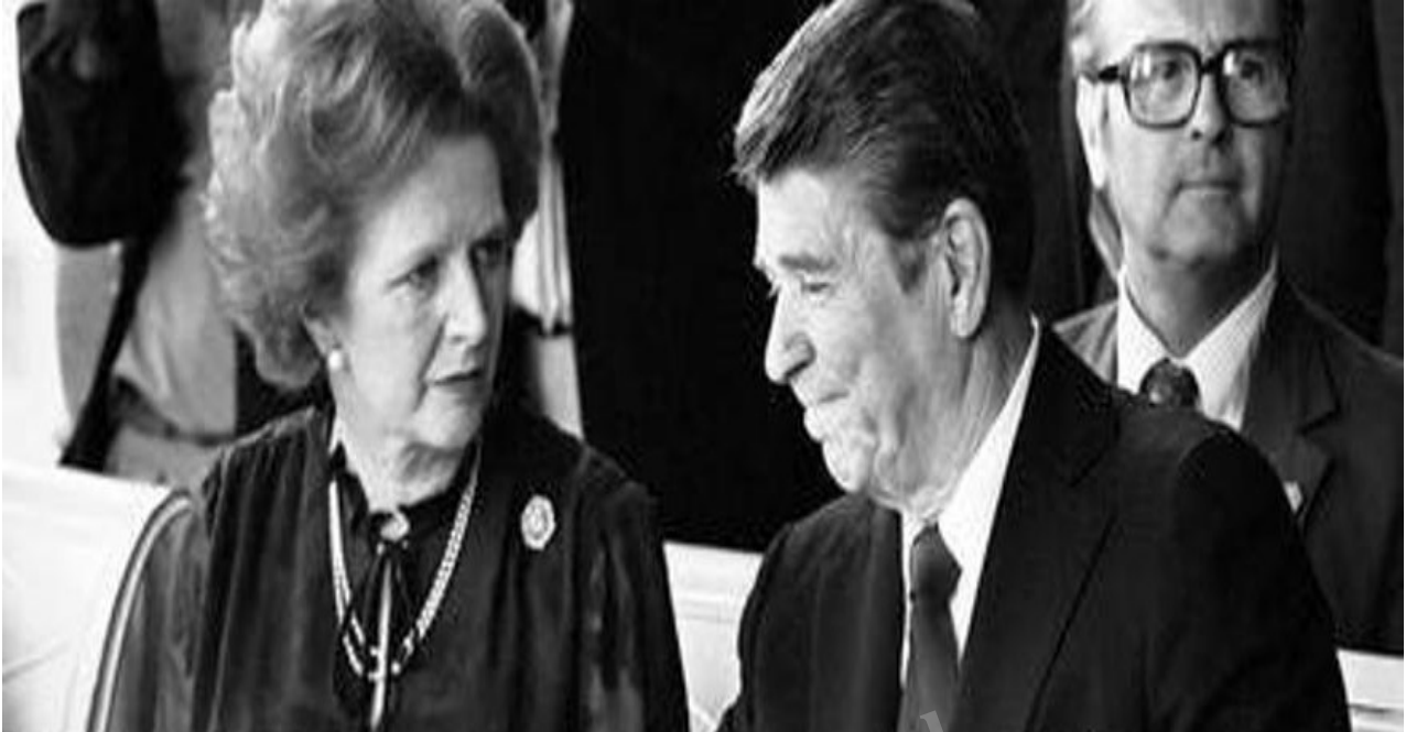
Margaret Theather y Ronald Reagan.

El capitalismo pareciera marchar victorioso. No es así, pero la percepción que ha logrado crear a través de toda su parafernalia mediático-cultural-ideológica (incluyendo el internet como poderosísima arma de control) así lo hace visualizar. Repitiendo lo dicho por un ícono del neoliberalismo, la británica Margaret Thatcher, la -impuesta- sensación dominante es que “ No hay alternativa ”.