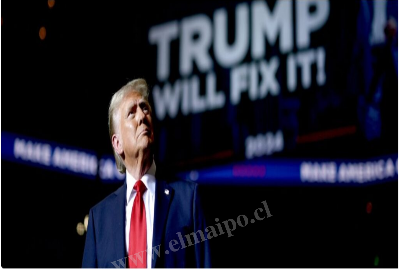
Donald Trump, presidente de EEUU.

4) Con la ascensión de Trump a la presidencia de la principal potencia capitalista, se abre un nuevo capítulo donde queda claro que Washington intenta recuperar el terreno perdido en estas décadas, poniendo como principal obstáculo para su geohegemonía a China. Lo que está claro también es que con las políticas neoliberales en curso se han precarizado a un grado extremo las condiciones de trabajo y de vida de los más amplios sectores del mundo, tanto en el Sur como en el Norte, habiendo salido de agenda, al menos temporalmente, los ideales socialistas y la búsqueda de transformaciones revolucionarias.